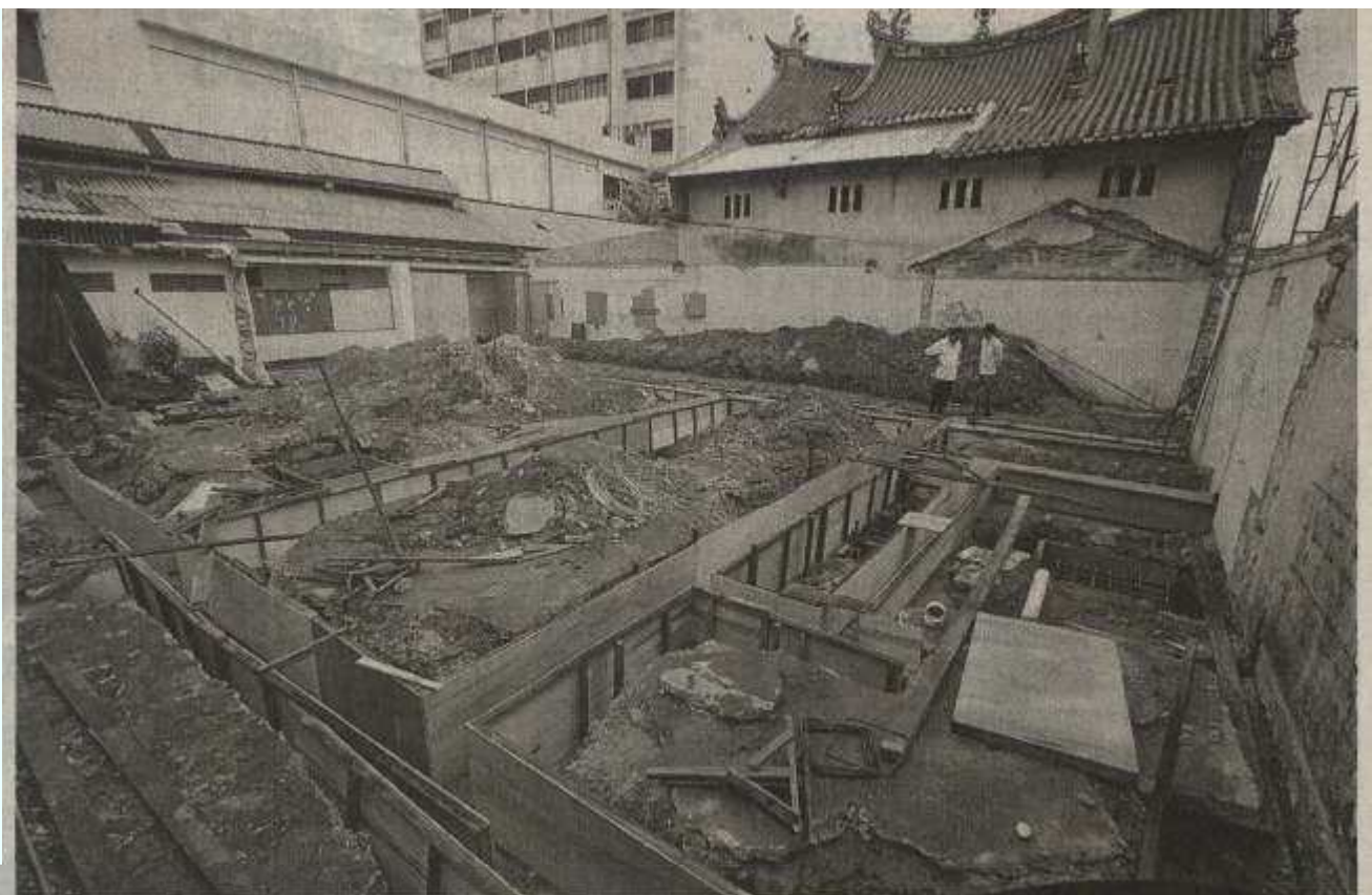
观音亭后方扩建工程因未获得青岛市政局批准而被下令停工。